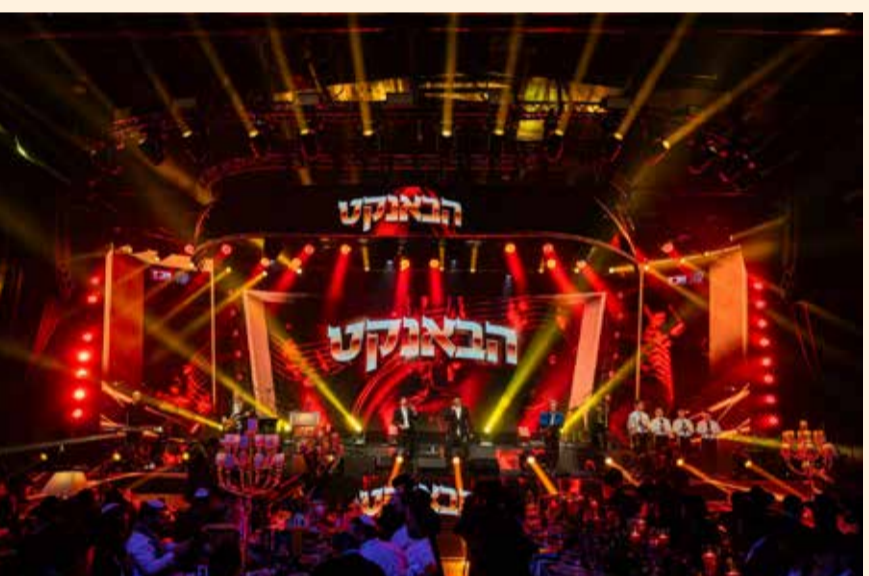
מצדיעים לשלוחי הרבי