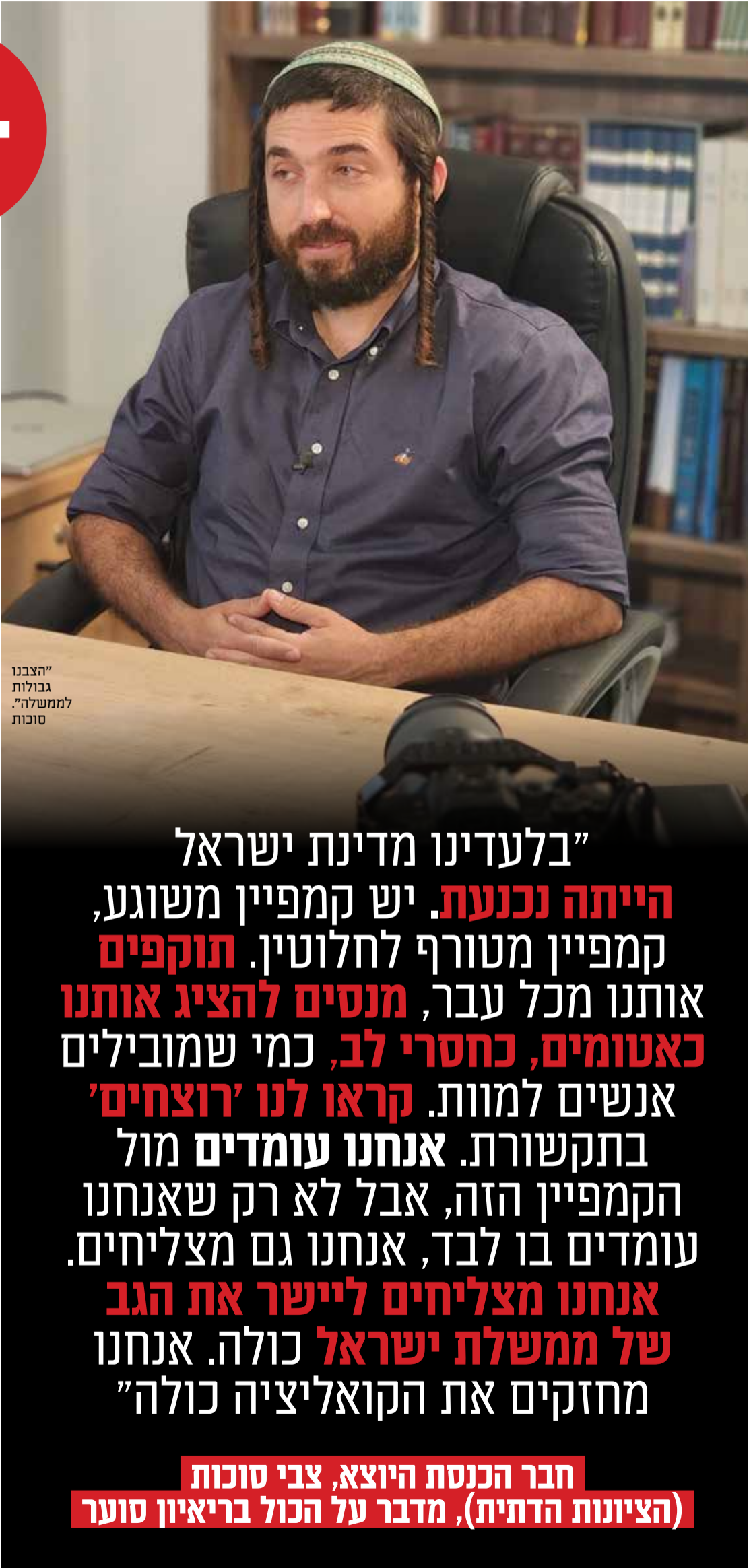
"הצבנו גבולות לממשלה". סוכות