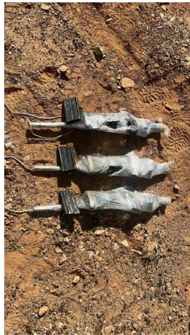
מצרים מסוכנת. כוחות צה"ל טיילו הברחת אמצעי לחימה במרחב מצרים