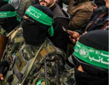
נחוטט את המאס. עזה, בחודש האחרון

"למרה הבער, הטרור בשומרון כיום מתפתח באינדספור רמות – אך מעבר לטרור ביהודה וגוש עציון. הרבב נובע בעיקר מהגירוש. זה צפון השומרון הפך לשטח הפקר. אין בו יהודים, אין בו צבא. הטרור מתחלחל היום בתעצם לממדים מפלצתיים. זהו חלק מהתנשאים שעליהם עמרנו בתוקף, אך אין בכך תהליף ליתר הדישיות שלנו.