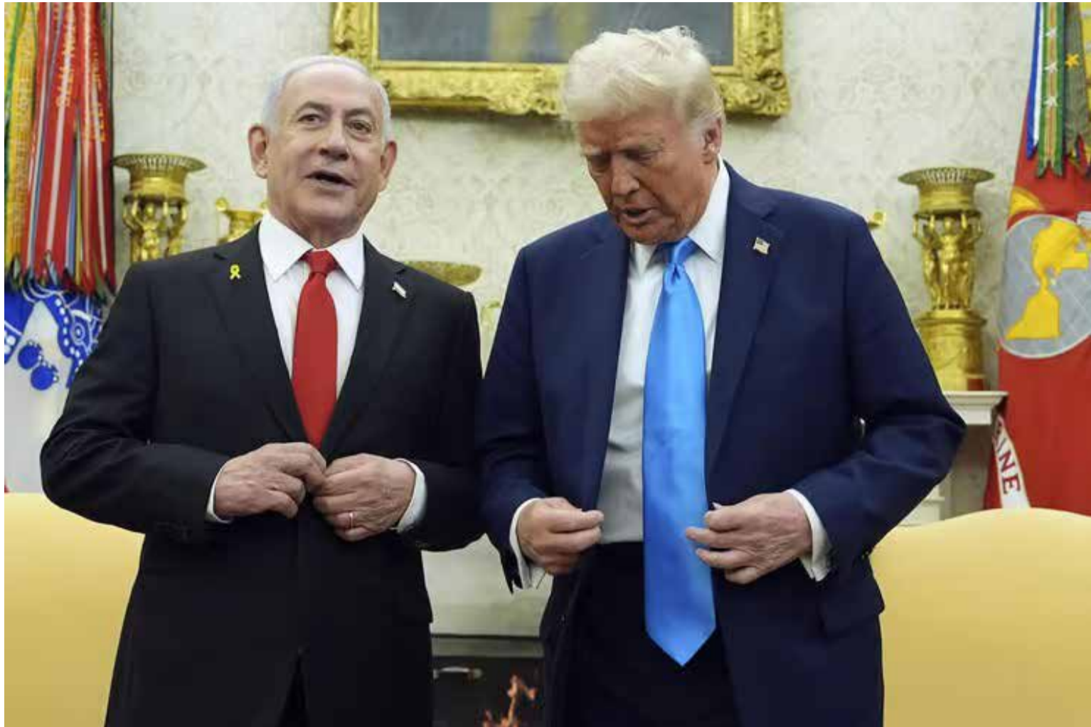
להבין את הנשיא טראמפ. מגישת מיוחדת ודרמטית בין הנשיא טראמפ וראש הממשלה נתניהו בחדר הסגלגל בבית הלבן

העולם כולו רועש וגועש. מנהגי מדינות מתייצבים אוטומטית לצד הפלסטין חצי מיליון האומללים, ומצהירים נחרצות כי גירוש הכפיה הוא קו ארום. התקשורת, בעיקר