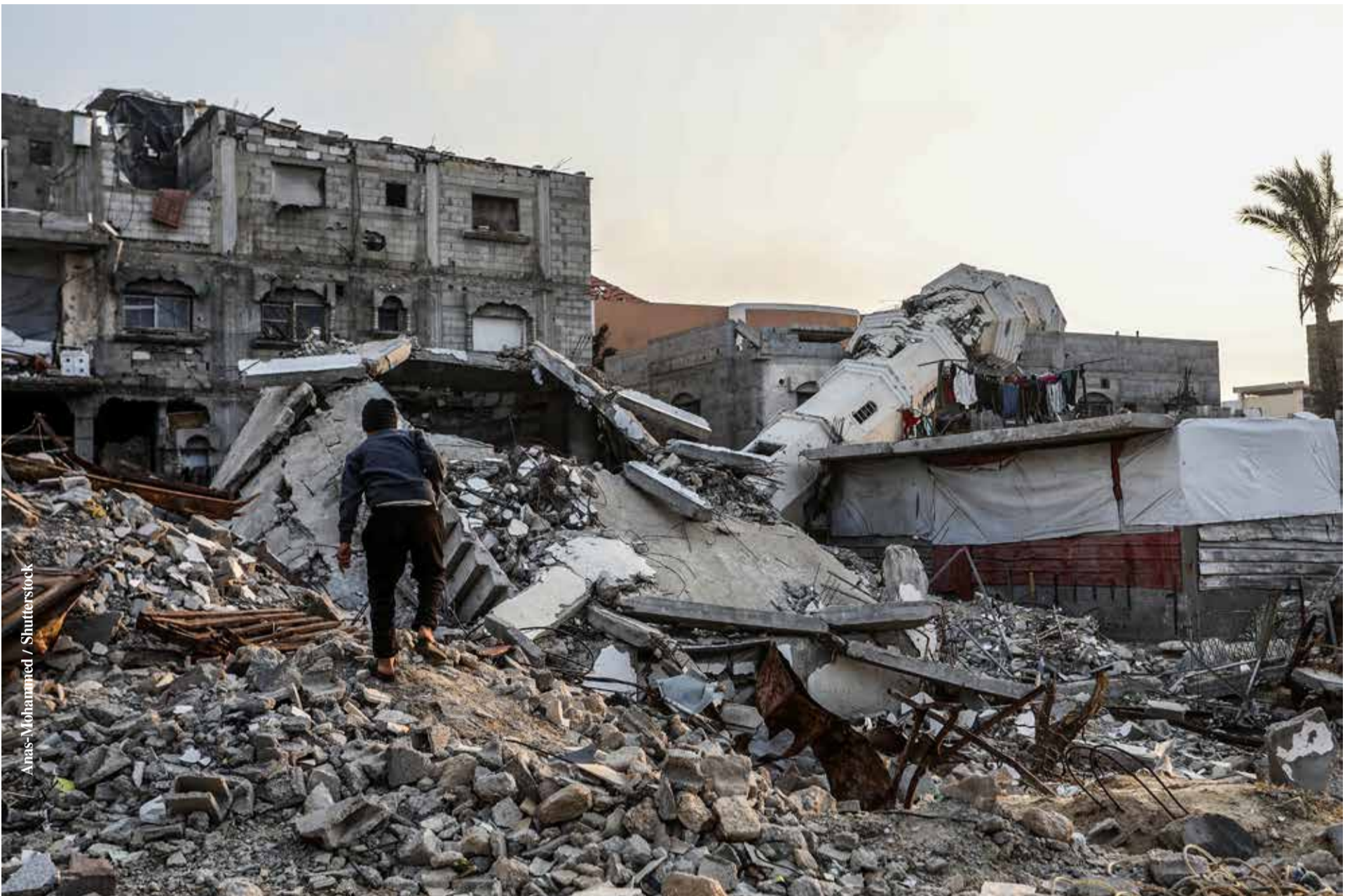
טראמפ רוצה לעשות טוף לכאב הראש העזתי ולהביא לפתרון אמיתי. עזה

לדבריו ב'מקור ראשון', "מצרים מודעת לחלך טין למצבה הרעוע. מערכת היחסים הרבי-ממדית שלה עם ארצות הברית אינה פוליטית בלבד, אלא כוללת גם תמיכה כספית וצבאית משמעותית. הרגישות של מערכת היחסים הזו מחייבת את ארצות הברית להנהל להתנהל בהחזרת מול ממשל טראמפ. מצרים חוששת שדחייה על הסף של תוכניתו של טראמפ עלולה לסכך את יחסיה עם וושינגטון, הממלאת תפקיד מרכזי בהבטחת הסיוע הבינלאומי למצרים - בין אם ישירות מארה"ב ובין אם דרך בעלות בריתה במפרץ. יתרה מכך, כל עימות דיפלומטי עם וושינגטון בסוגיה הפל'סטנית, עלול לחשוף את קהיר ללחצים פנימיים וחיצוניים שהיא אינה יכולה להרשות לעצמה". אשר לכן, מצרים מנסה להרוף בעיקפין את