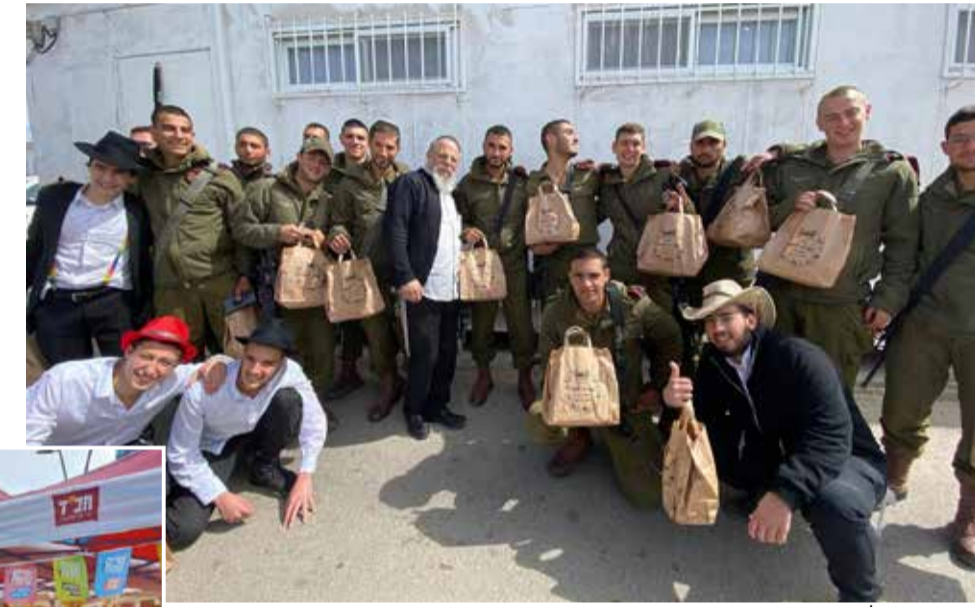
מבצעים בכל הוירות. מבצע פורים אשתקד

בעוד יהודים ברחבי העולם מתמודדים עם מציאות ביטחונית, חברתית ורוחנית מורכבת, שלוחי הרבי בכל היבשות נערכים למבצע פורים רחב היקף, מהגדולים שנועדו בשנים האחרונות. אלפי בתי חב"ד בעולם, מצפון אמריקה ועד אוסטרליה, יפעילו אלפי אירועי פורים, קריאות מגילה, מסיבות קהילתיות, חלוקת משלוחי מנות ופעילות מיוחדת עם יהודים מכל גוונים הקשת. השלוחים מרווחים על הערכת מוגי ברת השנה, מתוך תחושת שליחות מיוחדת להביא את שמחת החג דווקא בתקופה מאתגרת זו.