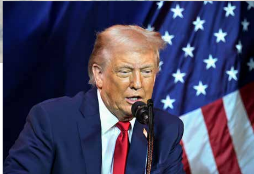
מזרח התיכון בדריכות שיא. טראמפ. למעלה: מטוסי ארה"ב

בשבוע האחרון הגיע ריכוז הכוחות האוויריים האמריקאים באזור אחוזים מהכוח האמריקאי. זה כוח אדיר, עצום. אלא שלמרות זאת הדעות חלוקות באשר להצבת הכוח